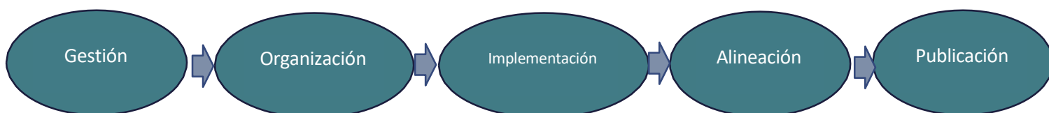
Imagen 3. Estructura Estructura de Desiciones TI-AAA. La Bellezana

Para la administración de las diversas iniciativas o decisiones del área TI se sigue el modelo presentado para lo cual se realizan reuniones internas de seguimiento.