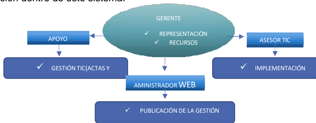
Imagen 2. Estructura Operativa de la Cooperativa AAA. La Bellezana

Teniendo en cuenta los objetivos estratégicos de TI plasmados en el Entendimiento estratégico - LI.ES.01 se muestra el mapa de procesos actual en la Cooperativa AAA. La Bellezana en el área de TIC, en donde se exponen los encargados y los procesos, con el fin de mejorar los procesos y procedimientos relacionados con la tecnología de la información dentro de este sistema.